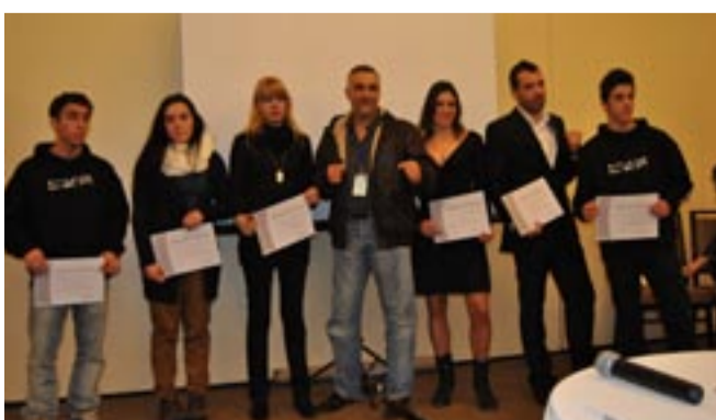
ATLETAS QUE REPRESENTARAM A SELECÇÃO NACIONAL receberam Menções Honrosas