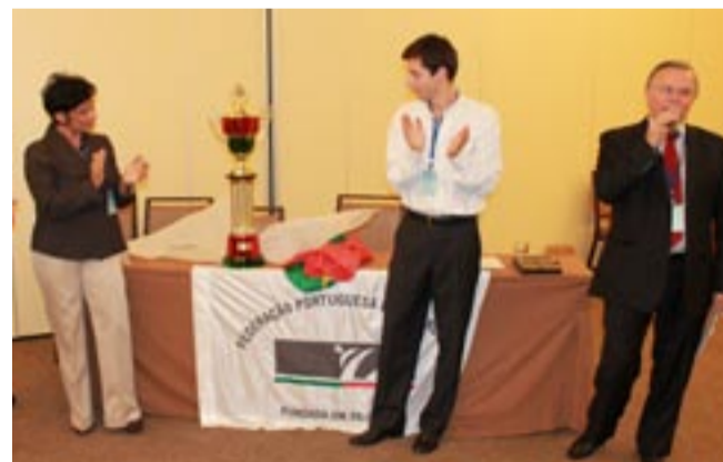
APRESENTAÇÃO OFICIAL DA TAÇA DE PORTUGAL que este ano se realiza em Torres Vedras